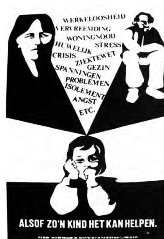
Poster Vereniging tegen Kindermishandeling, 1978

aldus nogmaals de VKM (Evers-Goddard, 1976: 18). En dat waren toen beginselen van het social case work als respect voor elke mens, partnerschap, tolerantie, acceptatie en recht tot zelfbeschikking (Kamphuis, 1961). En de toen nieuwe visies vanuit Bowlby's gehechtheidstheorie en Nagy's loyaliteitstheorie op ouderschap, opvoeding en ontwikkeling verdroegen zich slecht met dwang en drang en met drastische ingrepen in de verhouding ouder-kind. 'Wanneer men het kind ter beveiliging weghaalt uit het gezin, wordt het werk met de ouders erg belemmerd' (Evers-Goddard, 1976: 16).