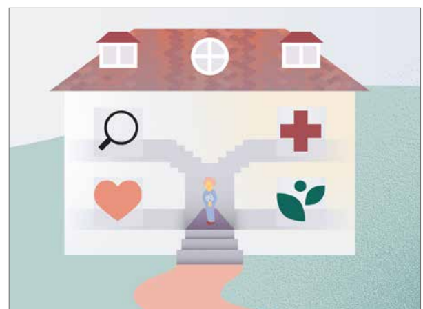
Afbeelding: Barnahus Four Rooms