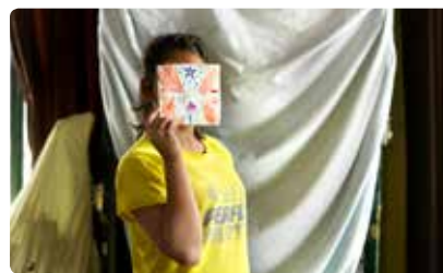
De activiteiten in Thailand maken onderdeel uit van het programma Down to Zero.