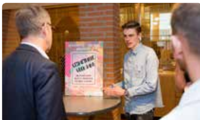
Jongeren leggen op het ministerie uit hoe armoede te bestrijden is