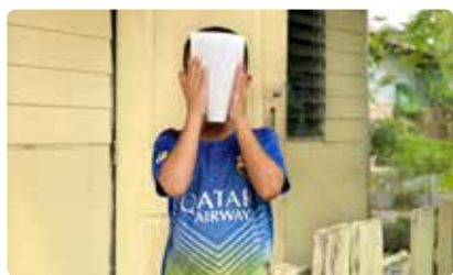
Fotograaf Marieke van der Velden maakte foto's in Thailand.