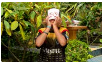
Van der Velden fotografeerde kinderen die slachtoffer zijn van seksuele uitbuiting of die het risico lopen uitgebuit te worden.