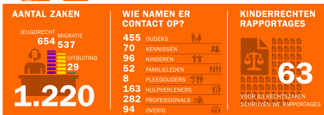
Tabel 1: Aantal Kinderrechtenhelpdeskzaken en aandeel per thema