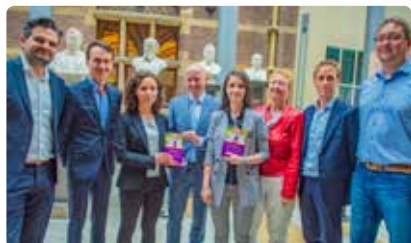
Jongeren overhandigen rapport over kinderen die in Nederland in armoede opgroeien